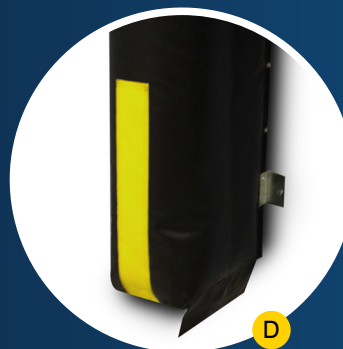
Rayures guides 24" (610 mm)