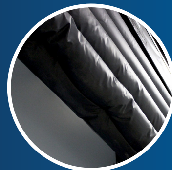
En Option: Retombée supplémentaire sur le sac de tête